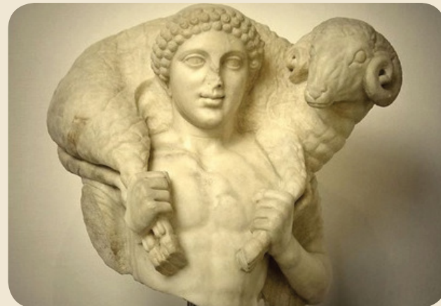
CRISTO BOM PASTOR

(Hermes Crióforo - apropriação pelos cristãos primitivos da iconografia da mitologia greco)