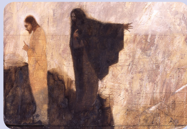
Tentação - J.KIRK RICHARDS – 1976