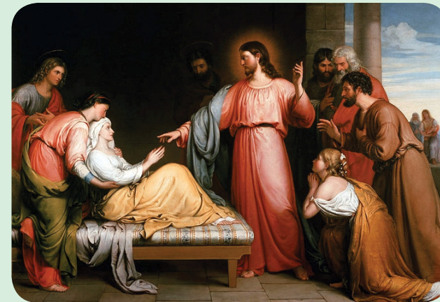
Jesus cura a sogra de Simão - JOHN BRIDGES - séc XIX