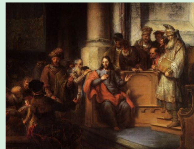
Jesus na Sinagoga . GERBRAND VAN DEN EECKHOUT . 1621-1647