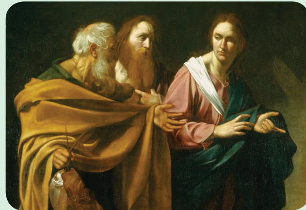
Chamamento de S. Pedro e Santo André - CARAVAGGIO - 1571-1610