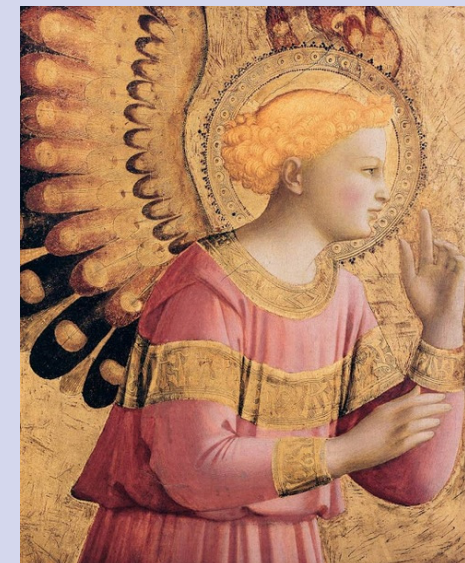
Arcanjo Gabriel, Anunciação (detalhe) Fra Angelico 1431-33