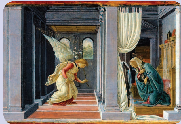
Anunciação – BOTTICELLI - 1445-1510