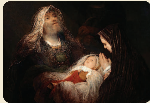
Simeão e Ana louvando o Menino Jesus - ARENT DE GELDER - 1645-1727