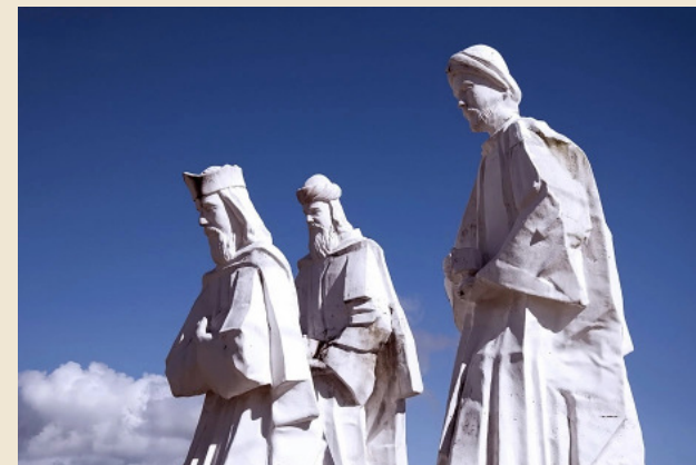
Estátua dos Reis Magos em Natal – Brasil