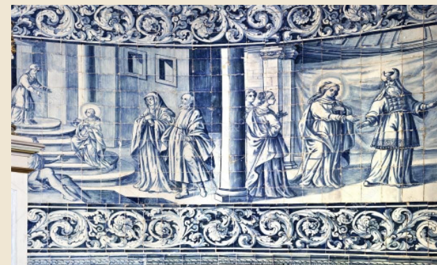
Painéis de azulejos que revestem o interior da Capela de Nossa Senhora do Socorro de Vila do Conde