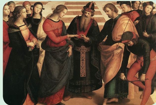
Spusalizio della Vergine - Raffaello – 1483-1520