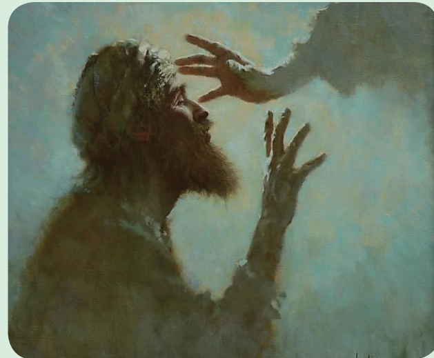
A cura de um cego - BRIAN JEKEL - 1951-