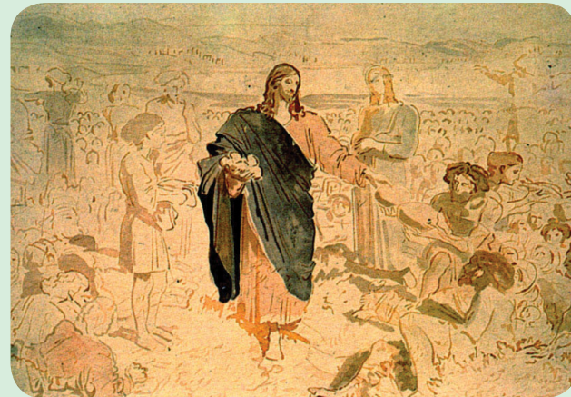
A multiplicação dos pães - Alexander Ivanov