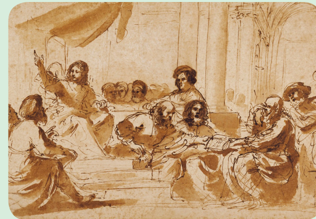
Jesus a pregar no templo de Cafarnaum, Guercino, c1625