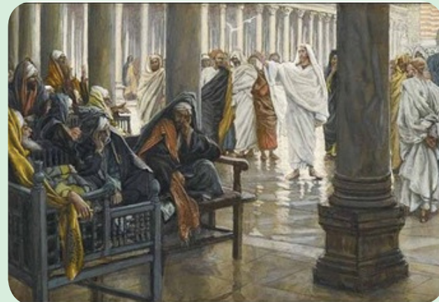
Jesus ensina na sinagoga - JAMES TISSOT - 1836-1902