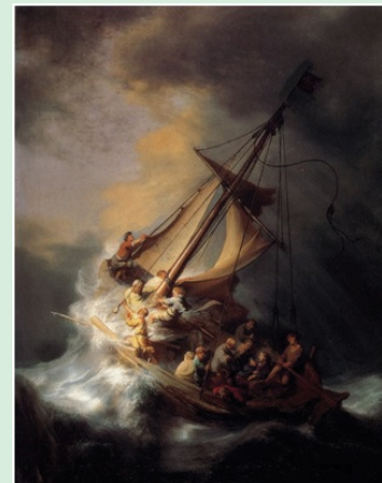
Cristo na tempestade no mar da Galileia - REMBRANDT 1606-1669