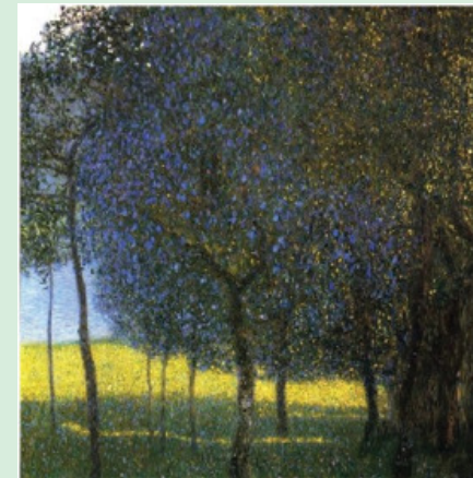
Árvores de fruta - GUSTAV KLIMT - 1862-1918