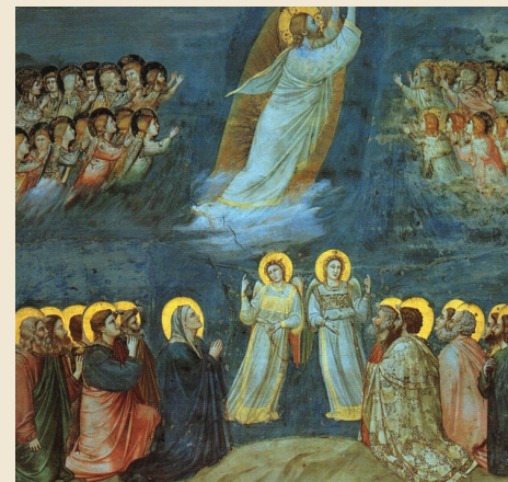
Ascensão - GIOTTO - 1267-1337