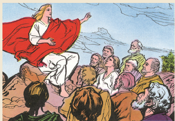
na Encarnação, na glória de seu Pai.

A Ascensão de Jesus é a última aparição do Ressuscitado que não só dá testemunho da verdade da Ressurreição, como faz compreender que Jesus vive agora na glória do Pai. A Ascensão manifesta assim o sentido pleno da Páscoa: depois de destruir o pecado e a morte com a sua Morte e Ressurreição, Jesus Cristo introduz o homem, que tinha assumido