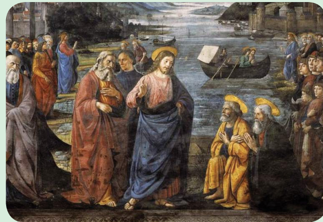
Chamamento dos Apóstolos - DOMENICO GHIRLANDAIO - 1449-1494